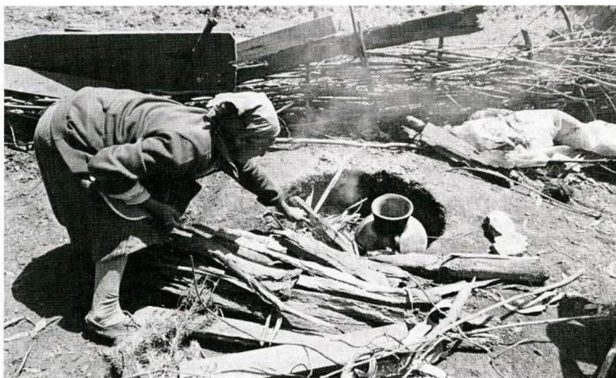
Fig. 1. Metaufes de roble huacho.

Zumaeta, Héctor. 1993. Las metaufes de Roble Huacho , Revista Museos , N° 12: 8-9, Dirección de Bibliotecas, Archivos y Museos, Santiago.