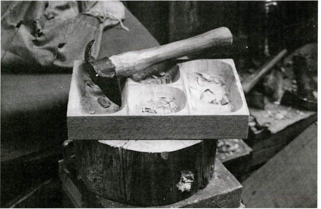
Fig. 4. Artesanía en madera de Liquiñe.